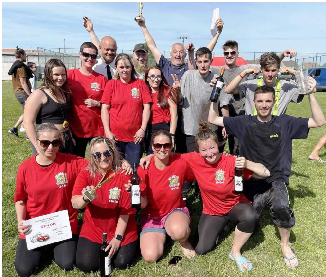
14.5.2022 - Naše úspěšné družstvo žen a mužů na Memoriálu Jana Hlaváčka, Sudovo Hlavno