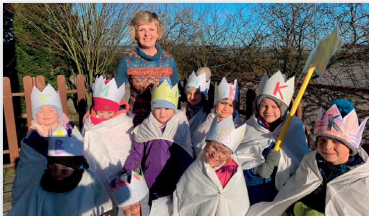
Tříkrálový průvod dětí z DS Hlaveneček 2022.

Duben bude plný jarního vyrábění, opět si přijdou na své i rodiče, kteří se budou chtít zapojit do společného tvoření s dětmi.