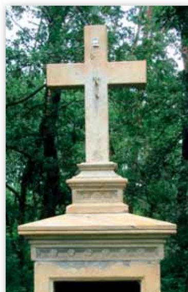
... a tak vypadá křížek dnes