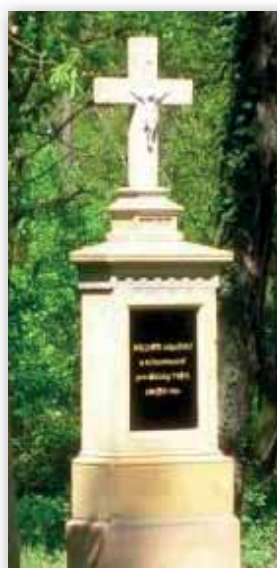
Tak vypadal křížek ještě letos v květnu