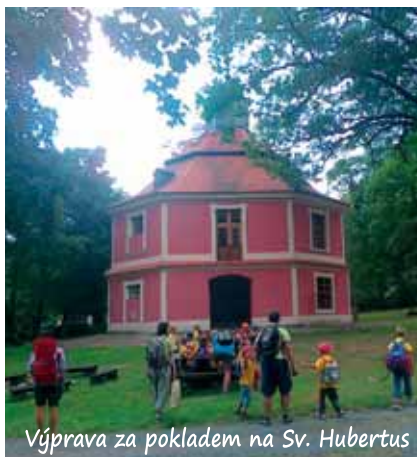
Výprava za pokladem na Sv. Hubertus