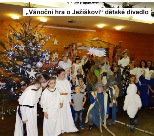
„Vánoční hra o Ježíškovi“ dětské divadlo