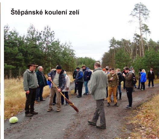
Štěpánské koulení zeli