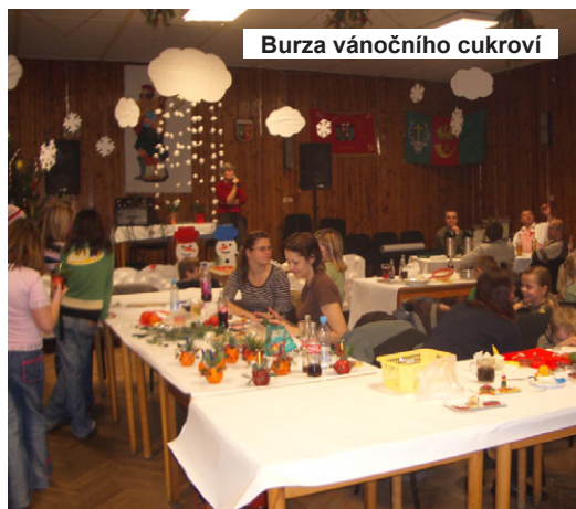
Burza vánočního cukroví