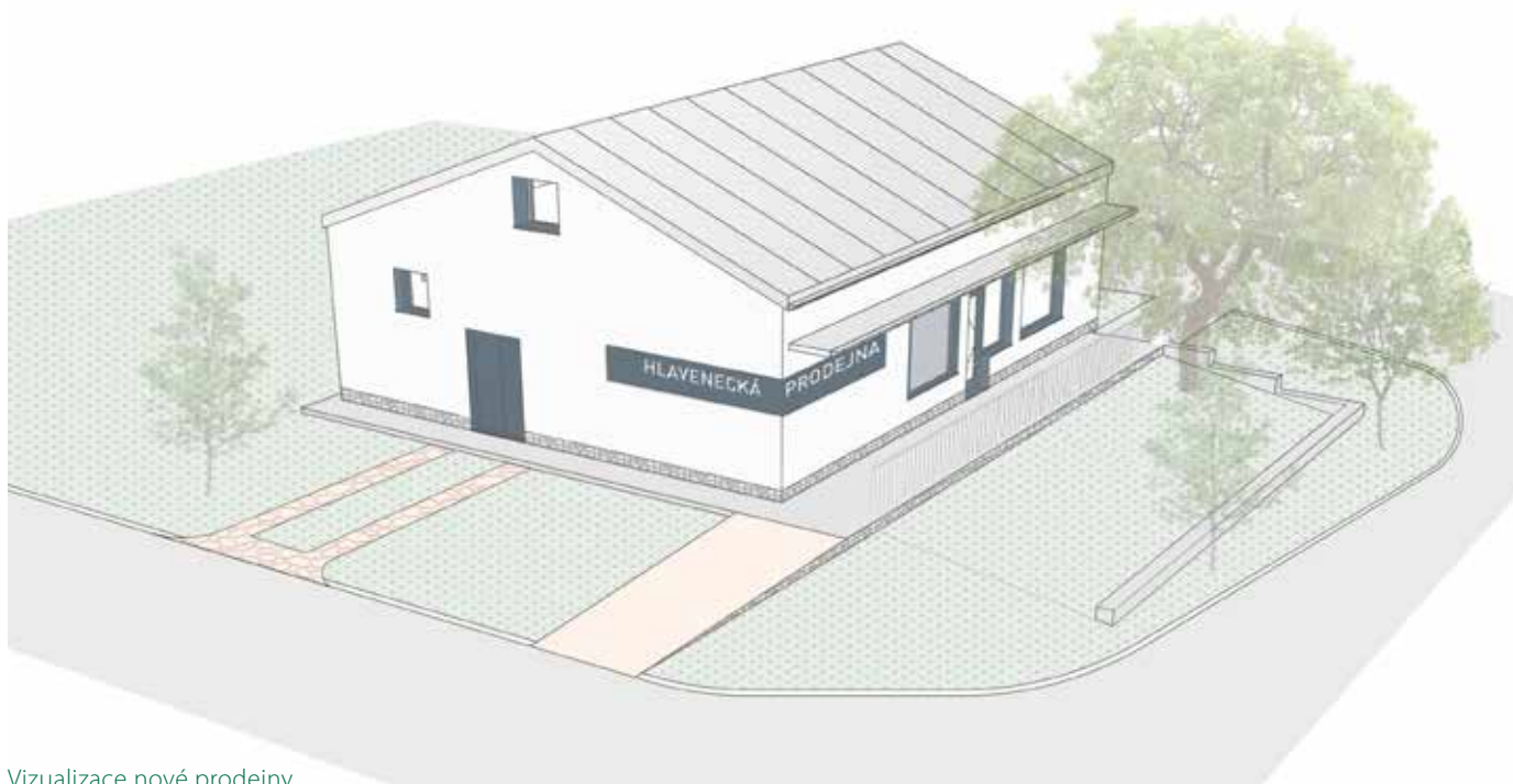
Vizualizace nové prodejny