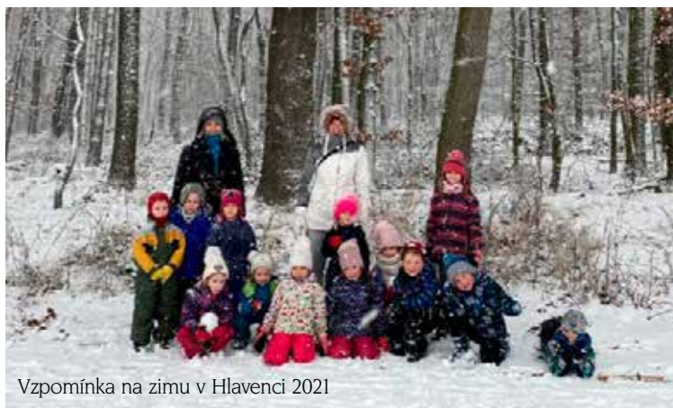
Vzpomínka na zimu v Hlavenci 2021

Těšíme se na vás a doufáme, že léto už si užijeme bez obav, ve zdraví, a hlavně společně 😊