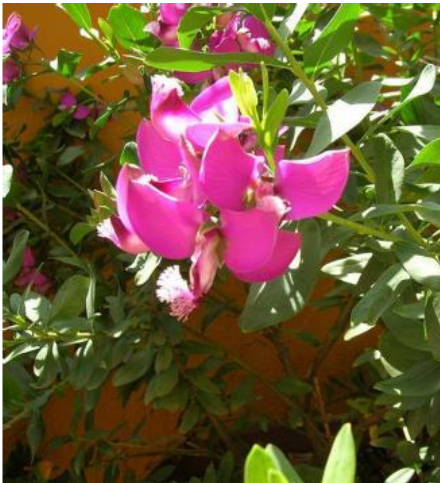
Vítod myrtolistý