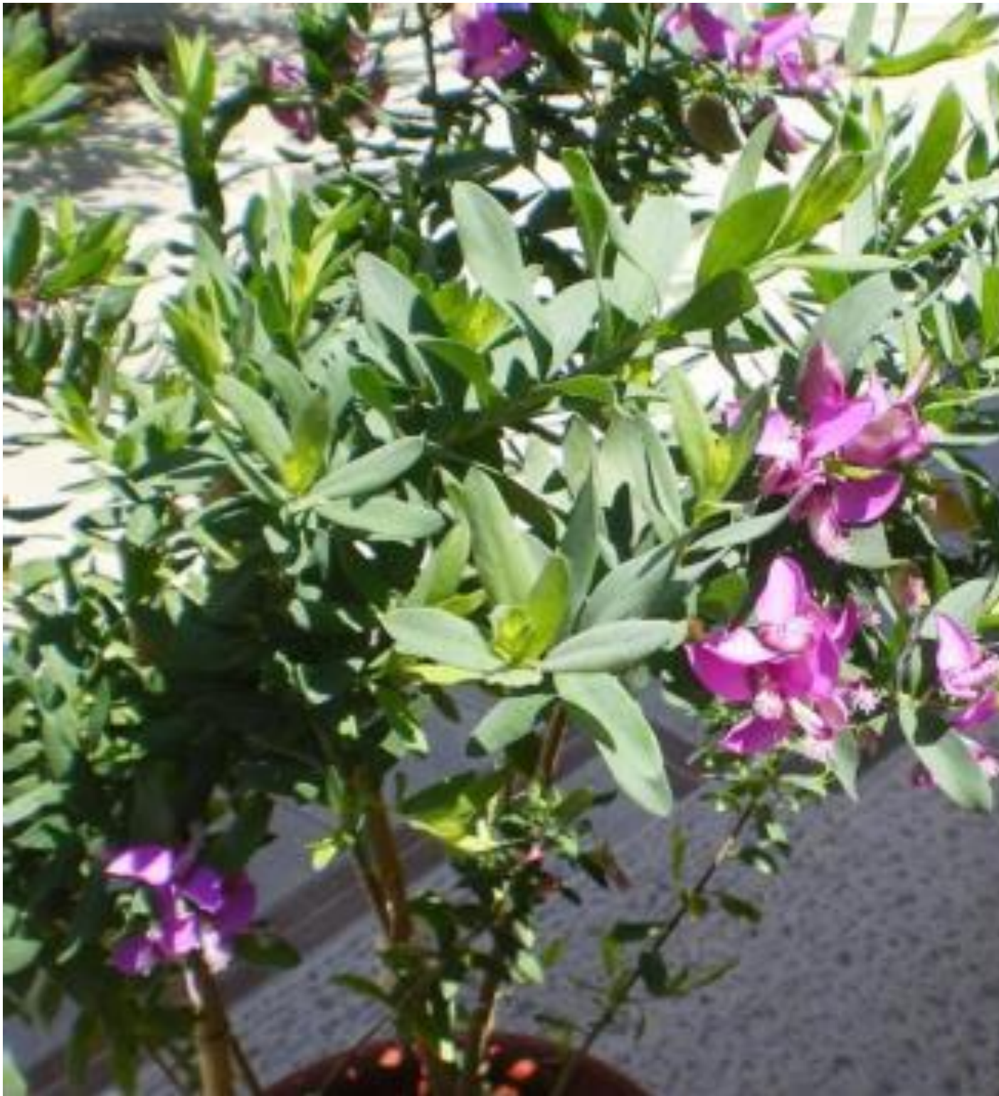
Bakterie Xylella fastidiosa